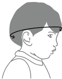
Obvod hlavy dieťaťa

Tip: Ak nemáte krajčírsky meter, zmerajte obvod hlavy akoukoľvek šnúrkou a nameranú dĺžku šnúrky potom zmerajte pevným metrom.